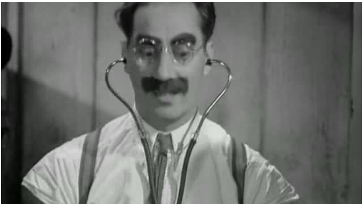
Fot. 1. Treść podpisu fotografii (Times New Roman CE 12 pkt)